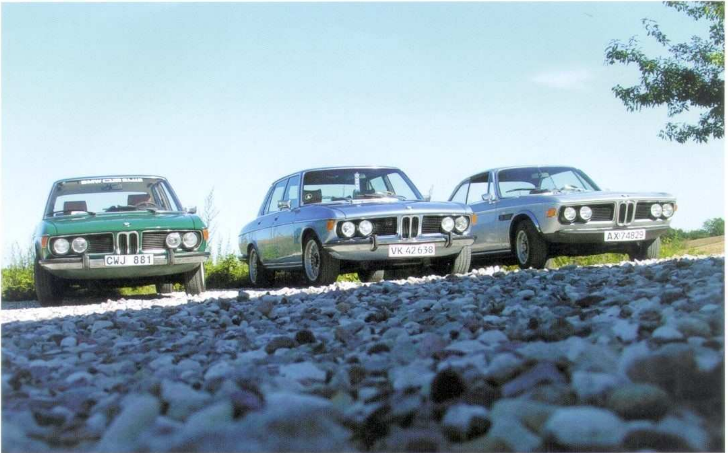
Herover: E3 2500, E3 3.0Si og E9 3.0CSL. Herlig cocktail!