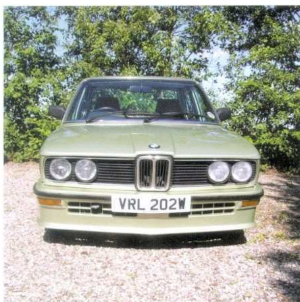
Paul Hill kom helt fra England i sin utroligt fine E12 M535i.