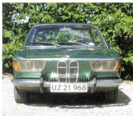
Længst til højre: Fin original 02 fra Sverige.